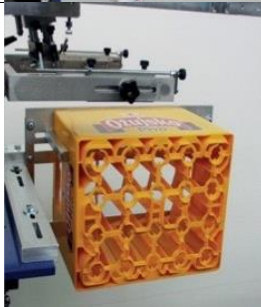
CZ Dispositif pour l'impression de caisses porte-bouteilles