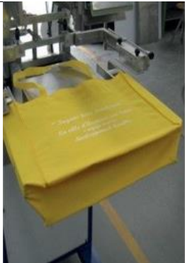
CB Dispositif avec plan et barres d'expansion pour l'impression de sacs publicitaires