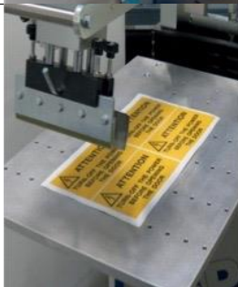
CH Dispositif avec aspiration (pompe incluse)