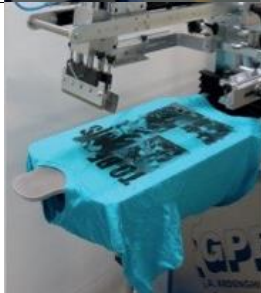
CT Plan d'appui pour l'impression de T-shirts