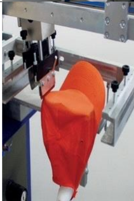
CK Dispositif pour l'impression de casquettes, chapeaux